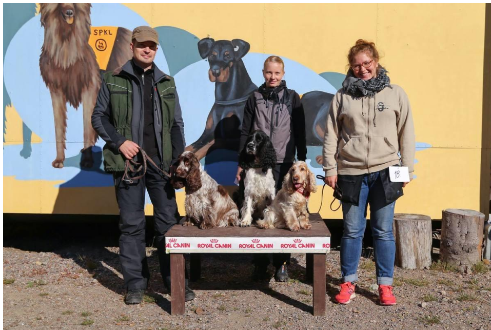
TOKOn joukkuemestaruus 2016

2000-luvulla kerho on uudistunut muuttuvan maailman mukana. Jäsenmäärä 2010-luvulla on ollut sadan molemmin puolin. Sillä on nykyisin omat nettisivut ja sen jäsenille on oma facebook-ryhmä. Viime vuosina koetoiminta on keskittynyt pääosin MEJÄ- ja taipumuskokeisiin. Kerho on myös järjestänyt useita kertoja Spanieliliiton TOKO-mestaruuskokeen. Kerho on hankkinut ostopalveluna kursseja jäsenilleen, mm. suosittua rally-tokoa. Lisäksi on kokoonnuttu ulkoilemaan kimppalenkille yhdessä koirien kanssa tai viety koiria uimalaan.