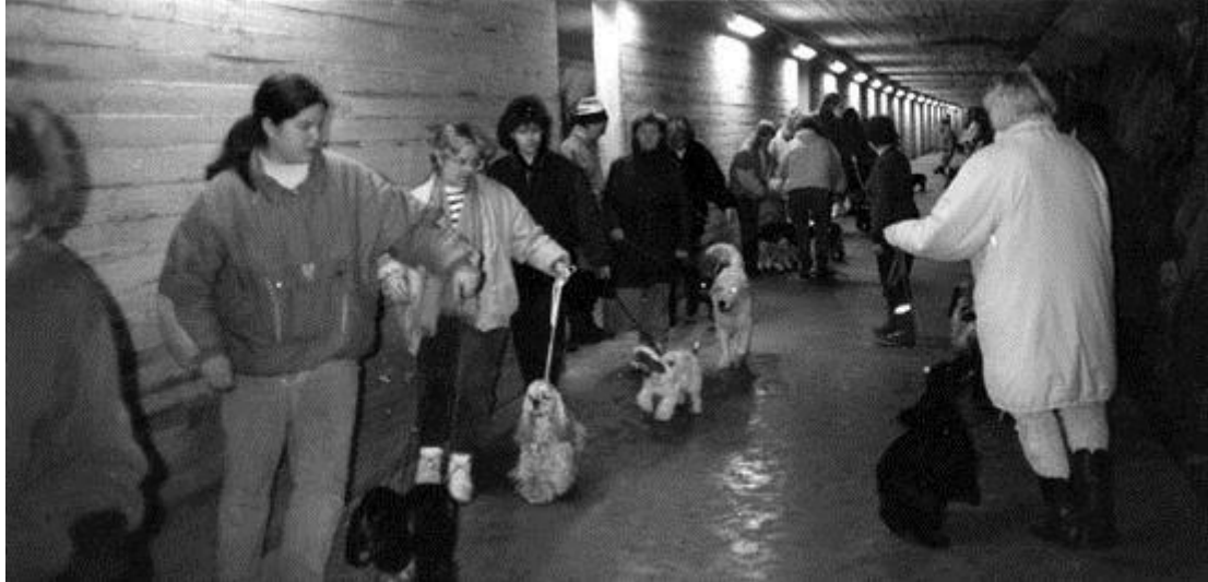
Näyttelyharjoitukset Myllypuron väestönsuojassa Helsingissä 1980-luvulla

kautta Myllypuroon, jossa niitä pidettiin viikoittain siihen saakka kunnes Helsingin kaupunki otti sen omaan käyttöönsä v. 2010.